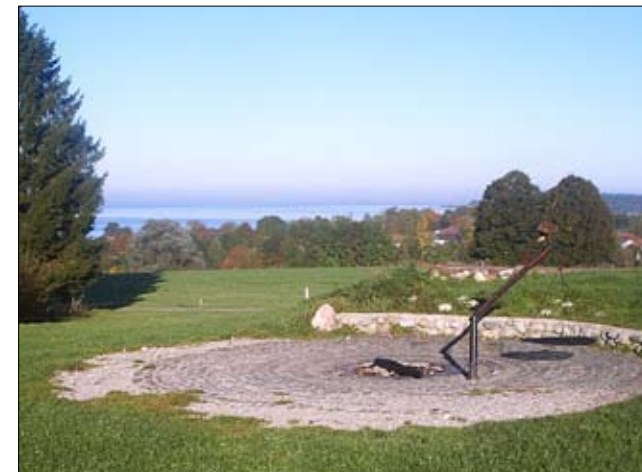
Feuerplatz mit Aussicht